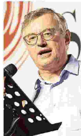
Alessandro Barbero, storico