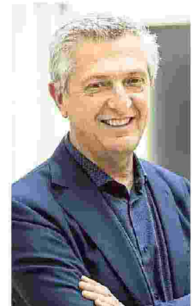
Filippo Grandi, Unhcr